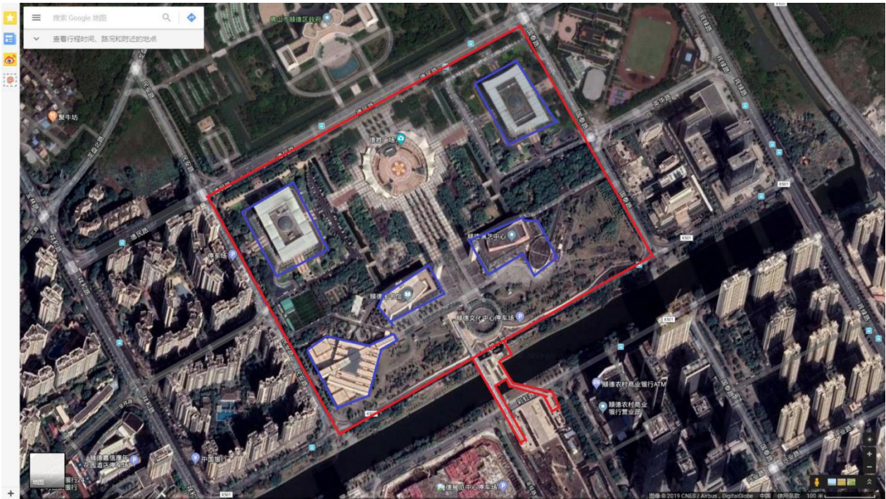
德胜文化广场绿化养护范围示意图（蓝色框内除外）